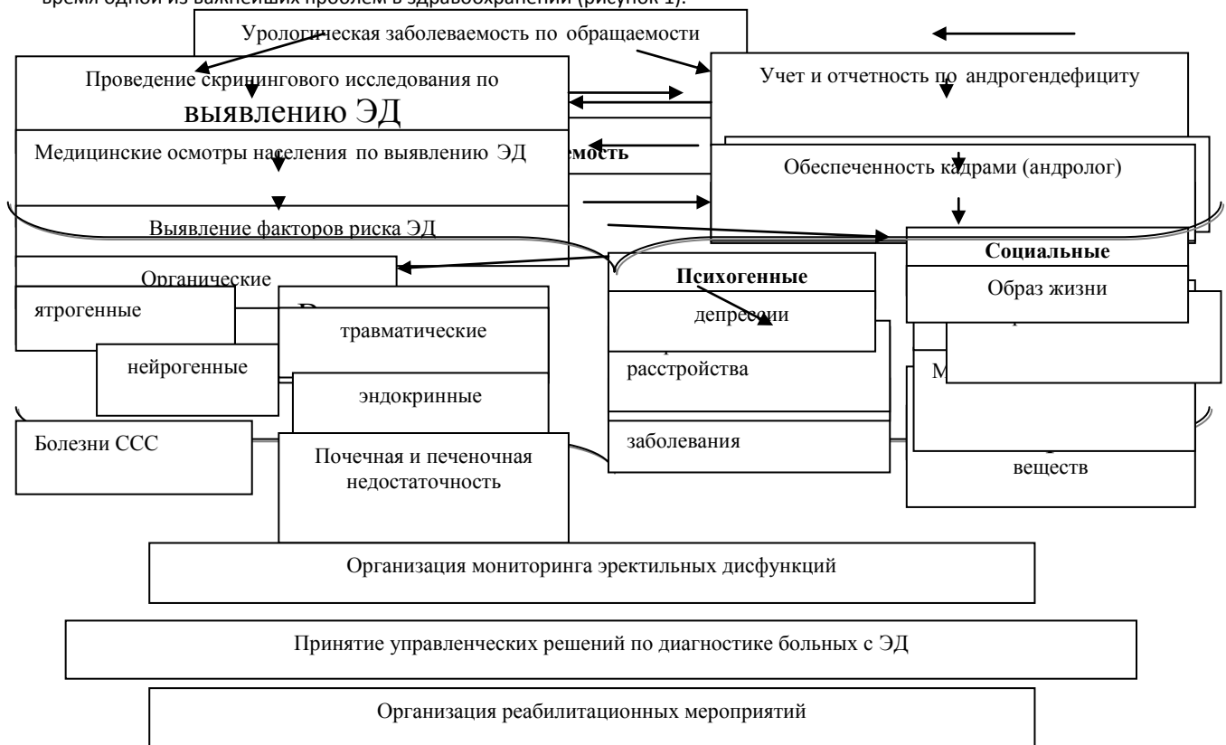
Рисунок 1 - Концептуальная модель управления здоровьем пациентов с ЭД

Система медико-социального исследования основана на предположении о том, что различные медико-социальные факторы создают опасность для здоровья мужчин. В связи с этим, оценка риска здоровью мужчин является в настоящее время одной из важнейших проблем в здравоохранении (рисунок 1).