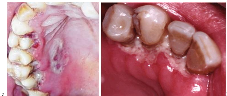
Рисунок 1 - а Больной. Обширные очаги некроза на слизистой оболочке полости рта.

После проведения обследования больному было назначено интенсивное общее лечение, включающее прием препаратов внутрь: трихопол для воздействия на анаэробную флору, кестин для снижения бактериальной сенсibilизации, нимесулид – нестероидный противовоспалительный препарат, подавляющий синтез простагландинов, играющих непосредственную роль в развитии воспалительного процесса и болевого синдрома, а также общеукрепляющие препараты в виде витаминного комплекса.