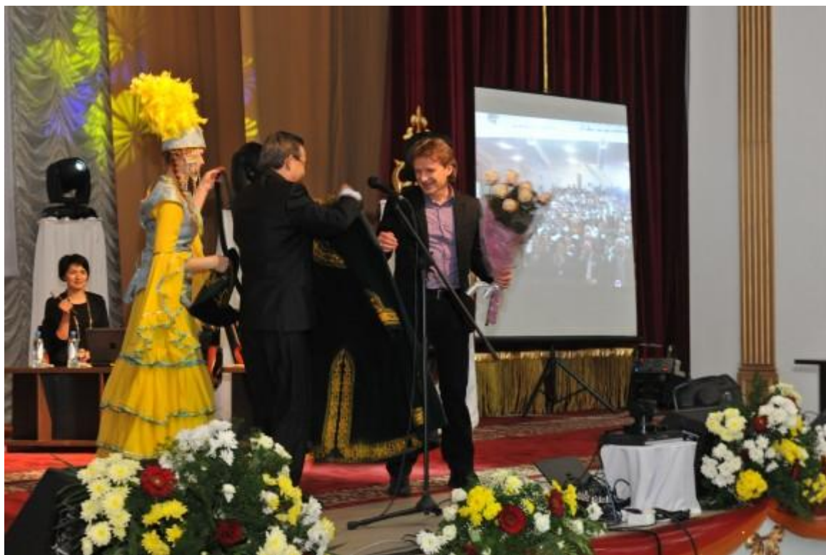
Концертная программа Дней Университета 2012 н.