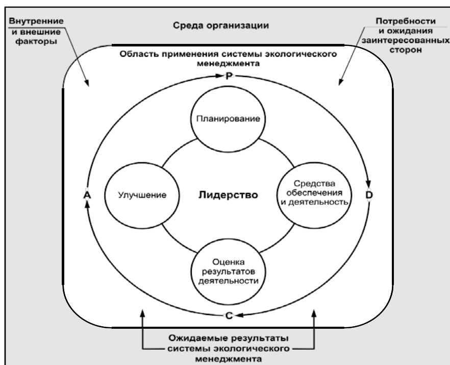
Рисунок 1 — Взаимосвязь между моделью PDCA и структурой настоящего стандарта