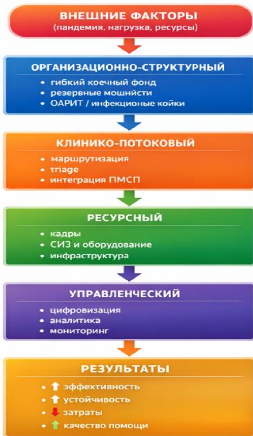
Рисунок 1. Подходы к совершенствованию стационарной помощи в условиях пандемии

Представленная схема демонстрирует системную взаимосвязь ключевых направлений совершенствования стационарной помощи. Внешние факторы, включая пандемию, рост нагрузки и ограничения ресурсов, формируют необходимость трансформации системы. Организационно-структурные, клиничко-поточковые, ресурсные и управленческие подходы выступают взаимодополняющими компонентами, обеспечивающими устойчивость и эффективность функционирования стационаров. Их интеграция приводит к